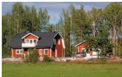
Ett av de nybyggda husen i Himmeta.