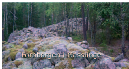
Fornborgen i Gäslinge