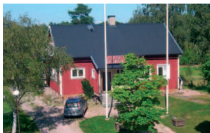
Bydegården i Himmeta.