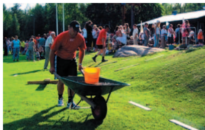
Byarna är många i Himmeta! Här är några bilder från den lekfulla gemenskapsfesten bykampen på hösten.